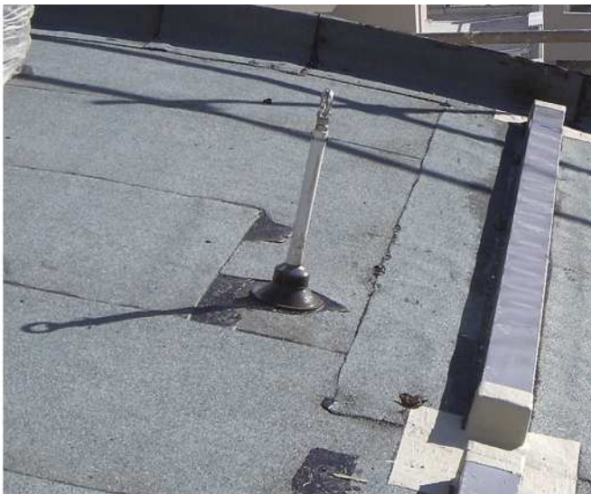
Abb.: Anschlagpunkt für Sicherungssystem

Bei begehbaren Dachgärten sind Geländerkonstruktionen unabdingbar, bei Extensivbegrünungen sind für die Pflege und Wartung Anschlagvorrichtungen für die persönliche Schutzausrüstung vorzusehen (siehe Merkblatt «Absturzsicherungen auf Steildächern», GH Schweiz).