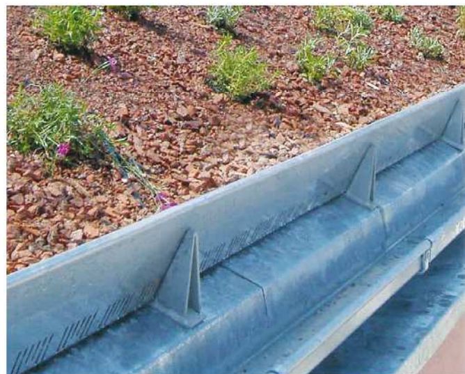
Abb.: Schubsicherung an der Traufe

Zur Sicherung der Lagenstabilität sind ausser eventuell notwendiger Schubschwellen geeignete Draineelemente in denen das Substrat gut «verzahnt» zu verwenden.