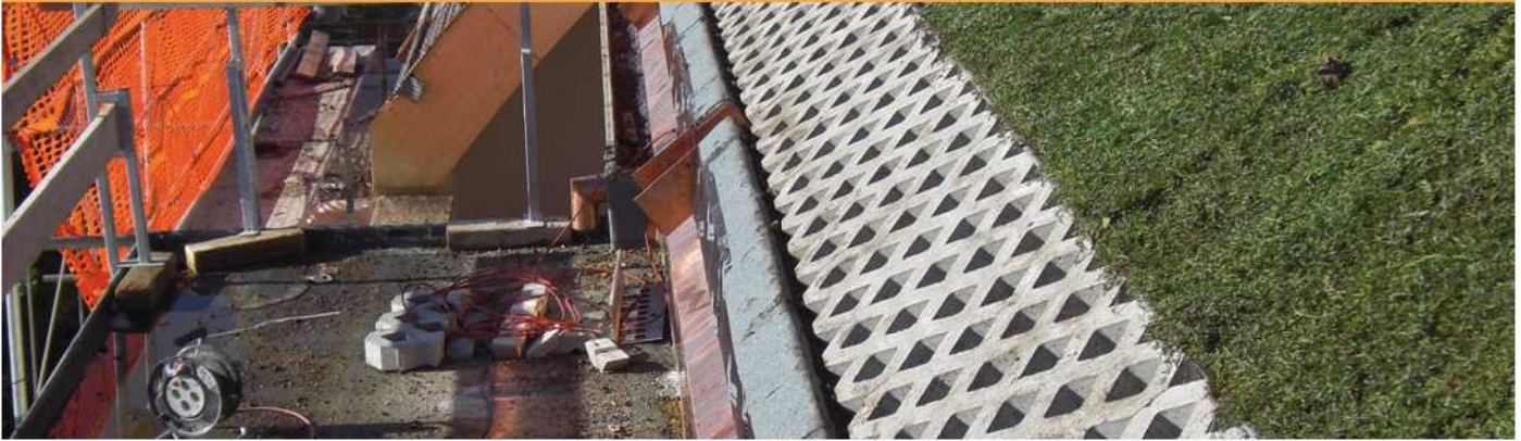
Abb.: Dachaufbau Dachbegrünung, Traufe mit Entwässerung