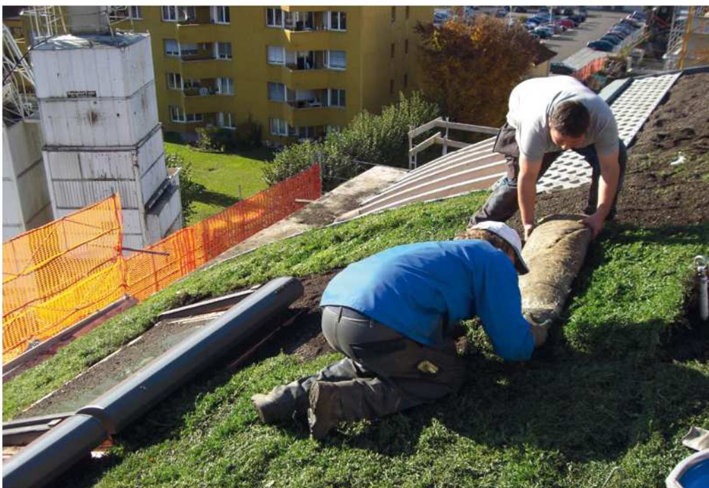
Abb.: Verlegen von Vegetationsmatten

An windexponierten Standorten und bei stark geneigten Dächern sollten Nassansaat oder vorkultivierte Vegetationsmatten eingesetzt werden. Bei Dachrändern und auf besonders verweh gefährdeten Teilflächen muss die Begrünung mit Vegetationsmatten oder Gewebematten gesichert werden.