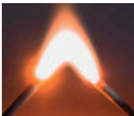
Lichtbogen sind sehr helle und heisse elektrische Entladungen.

Gleichstrom erzeugt bei einem Kurzschluss lange andauernde Lichtbogen. Diese sind extrem hell und können im Gegensatz zu Funken bei Wechselstrom über Minuten oder sogar Stunden bestehen bleiben. Der direkte Blick in einen Lichtbogen kann durch die intensive Strahlung die Augen