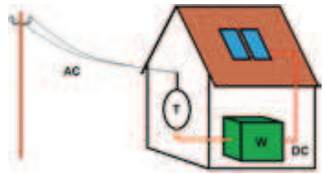
Die in den Photovoltaikmodulen erzeugte Elektrizität (DC) wird im Wechselrichter zu Wechselstrom (AC) umgeformt. Der Trennschalter (T) ermöglicht ein Trennen der Anlage vom Netz.

Rechtzeitige und ausreichende Belüftung verhindert, dass die Explosionsgrenze überschritten wird. Am einfachsten geschieht dies noch immer durch das Öffnen von Fenstern und Türen. Da sich Wasserstoff äusserst schnell verflüchtigt, dürfte dies in den meisten Fällen ausreichend sein.