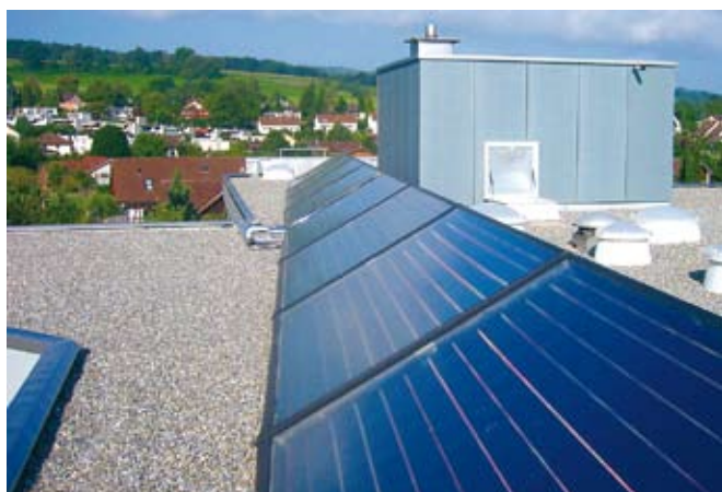
Solaranlage auf Flachdach